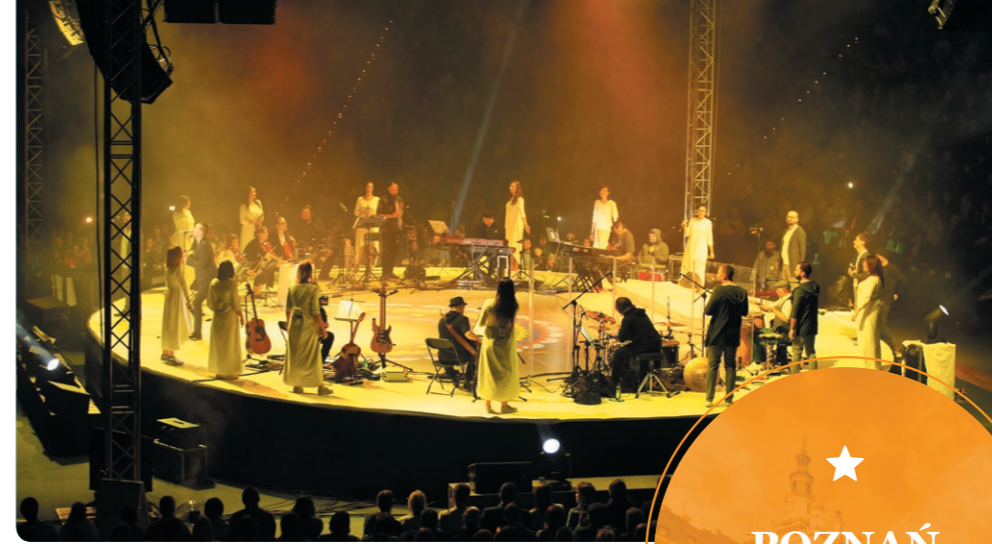
★ POZNAŃ Arena Poznań 06-01-2017