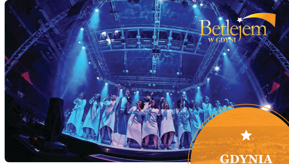
★ GDYNIA Arena Gdynia 07-01-2017