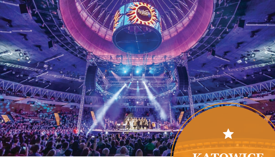
★ KATOWICE Spodek Grudzień 2014, 2015, 2016