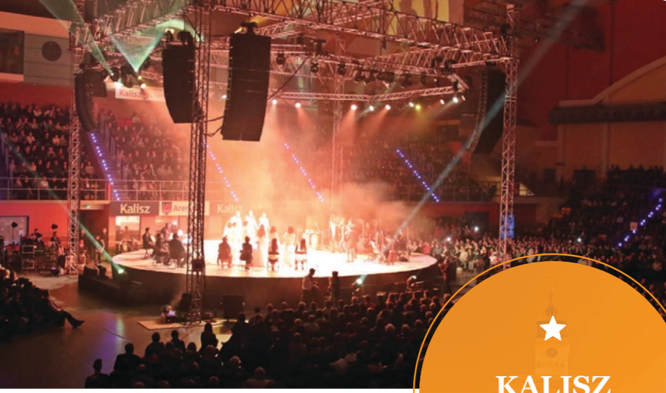
★ KALISZ Arena Kalisz 04-01-2017